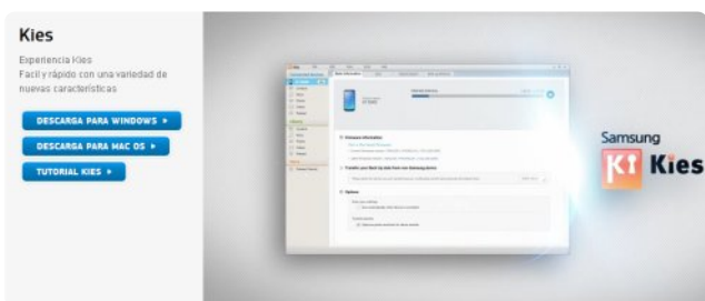
Figura 2. Sitio oficial de descarga del programa KIES.

Un teléfono móvil es como un ordenador en miniatura y necesita un sistema operativo que lo haga funcionar. En un PC se usa Windows, Linux, iOS, etc. Un teléfono inteligente usa Android. Un sistema operativo conviene tenerlo actualizado para incluir nuevas mejoras, corregir errores y aumentar la seguridad. KIES te actualizará el móvil y además te permitirá conectarte a Internet con tu portátil usando tu teléfono como router wifi o usando un cable usb.