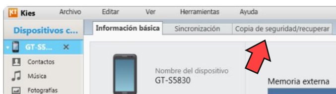
Figura 4. Pestaña "Copia de seguridad/recuperar".

KIES muestra el móvil (véase figura 4). Haz clic en la pestaña "Copia de seguridad/recuperar" (flecha roja) para seleccionar los elementos que deseas guardar en tu copia de seguridad.