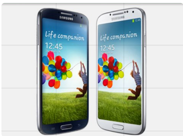
Figura 1. Teléfonos Samsung con sistema Android.

También se puede encontrar tecleando en Google "Samsung KIES" (sin poner comillas).