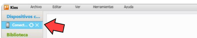
Figura 3. El teléfono se está conectando a KIES.

Para usar el programa KIES, lo primero es descargarlo del sitio oficial (véase figura 2) e instalarlo. Recuerda que necesitará ser administrador para realizar la instalación. Conecta el móvil Samsung al ordenador usando un cable usb y arranca KIES. Durante los primeros segundos verás un pequeño círculo animado, indica que la conexión se está realizando (véase figura 3).