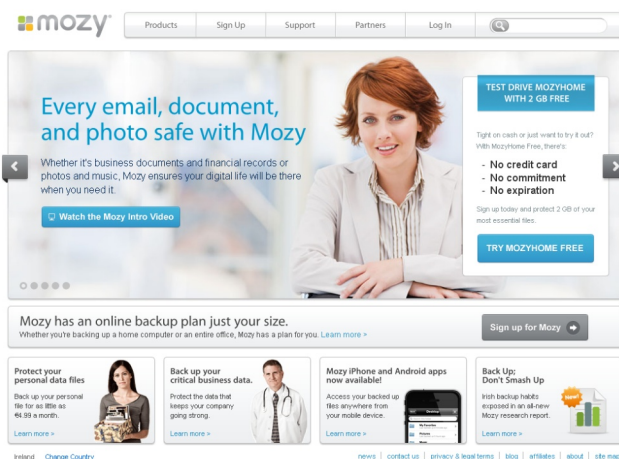
Figura 1. Mozy (www.mozy.ie) guarda tus datos online.

Es una buena idea tener todos los documentos es una carpeta en nuestro ordenador habitual, que podemos llamar "Datos" y donde guardaremos los archivos con los que trabajamos habitualmente. Haremos una copia de esta carpeta completa a otro disco o usb externo.