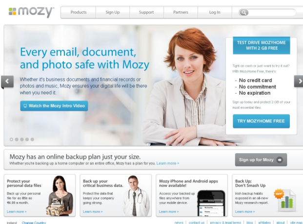
Figura 1. Mozy (www.mozy.ie) guarda tus datos online.

Es una buena idea tener todos los documentos es una carpeta en nuestro ordenador habitual, que podemos llamar "Datos" y donde guardaremos los archivos con los que trabajamos habitualmente. Haremos una copia de esta carpeta completa a otro disco o usb externo.