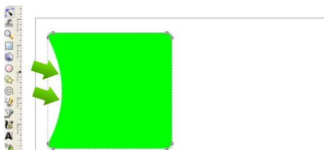
Figura 2. Segmento modificado usando el ratón.

Usaremos la herramienta "Editar nodos de trayecto..." (atajo F2) para modelar la forma convertida a trayecto (véase flecha en la figura 1). Haz clic en dicha herramienta, acerca el ratón al borde izquierdo de la forma, haz clic en él y sin dejar de pulsar el botón izquierdo del ratón, muévelo hacia el interior de la forma, verás como el segmento comienza a curvarse (véase figura 2).