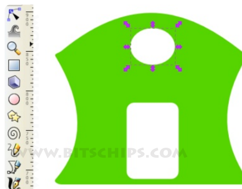
Figura 4. Dibujo compuesto por tres formas.

Quizá ahora es buen momento para guardar tu trabajo. El siguiente paso es dibujar la ventana y la puerta. Selecciona la herramienta "Crear círculos, elipses y arcos" (F5) y dibuja una ventana como puede verse en la figura 4. Selecciona la herramienta "Crear rectángulos y cuadrados" (F4) para dibujar la puerta. Es una buena idea seleccionar el color antes de usar dichas herramientas, ya que por defecto se usa siempre el último color utilizado. Si no se cambia, se dibujará con el mismo color del fondo y no se verán los nuevos objetos. Selecciona el color blanco para la puerta y la ventana. El resultado debe quedar como en la figura siguiente.