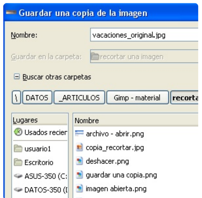
Figura 3. Explorador de ficheros de Gimp.

A partir de ese momento, puedes hacer los retoques que desees ya que tendrás una copia almacenada en disco.