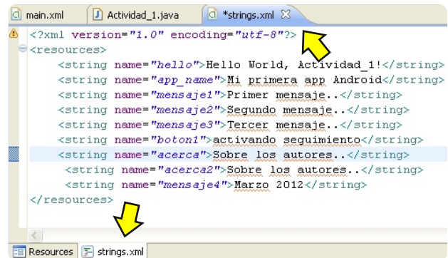
Figura 3. Lista de etiquetas en "strings.xml".

Observa la figura 3. Cada línea corresponde a un mensaje diferente. El texto entre comillas, por ejemplo "hello", es el identificador de cada mensaje, será el nombre a usar en tu código para mostrar el texto que aparece justo detrás del signo ">".