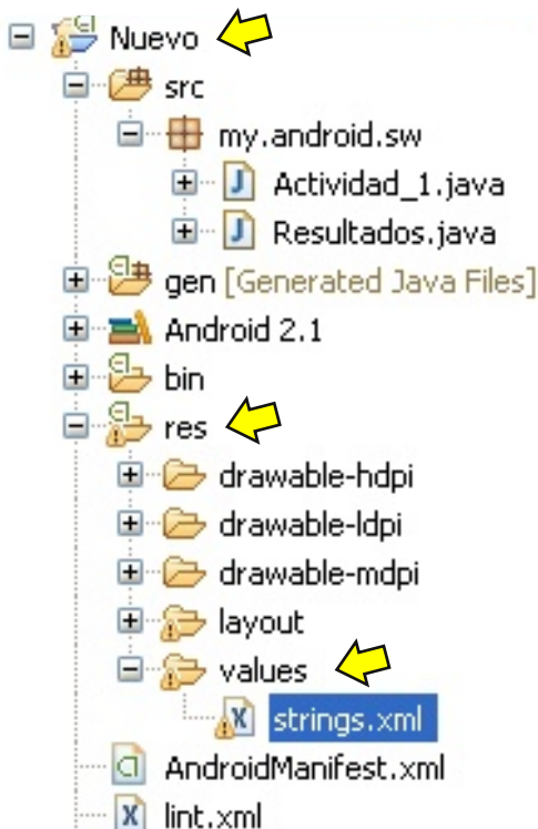
Figura 2. Ubicación del archivo "strings.xml".

Vamos a echar un vistazo al fichero. Búscalo en el panel "Package Explorer" en la ruta "proyecto/res/values/" (véase figura 2). Haz doble clic en "strings.xml" para abrirlo. Este archivo comienza con la etiqueta "<resources>" y para cada texto hay una etiqueta "<string name=...>" (véase figura 3).